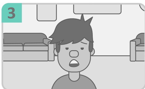
Cansancio, malestar en general y dolor de articulaciones.