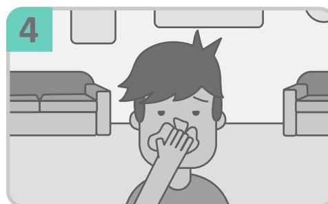
Congestión nasal, dolor de cabeza, conjuntivitis, dolor de garganta y diarrea;